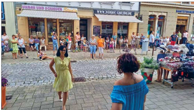
Glauchau rockte zur Modenschau von Moda Italiana.

Am 16. Juli luden die Glauchauer Interessengemeinschaft für Handel und Gewerbe und die Glauchauer Wirtschaftsförderung zum Einkaufen in die Glauchauer Innenstadt ein. Unter dem Motto „Willkommen zurück“ gab es verschiedene Händleraktionen und zahlreiche Straßenkünstler ließen den Abend für die Besucher zu einem besonderen Erlebnis werden.