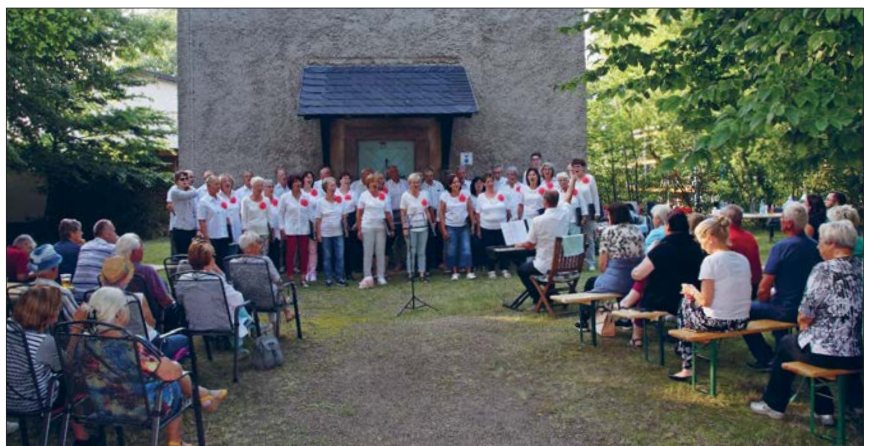
Der Georgius-Agricola-Chor konnte bei seinem Benefizkonzert am Wasserturm zahlreiche Besucher begrüßen.

Unsere Freude war am Ende riesig, als wir den Spendentopf leerten: Über 850,00 Euro an Konzerteinnahmen. Diese Summe wurde durch den Roster-Verkauf zusätzlich aufgestockt auf über 1000,00 Euro! Dieses Geld haben wir auf das Spendenkonto bei der Stadt Glauchau eingezahlt, und von dort kommt es in Absprache