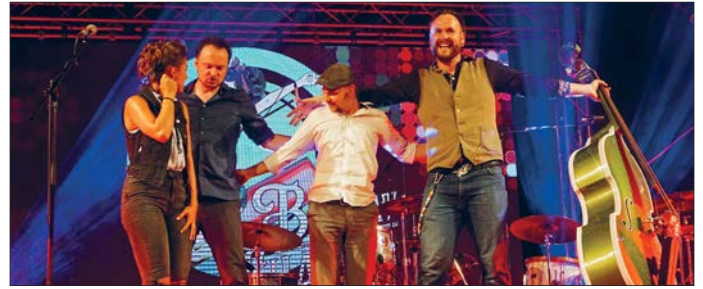
Die Band Big Fat Shakin brachte eine mitreißende Show und zeigte sich am Ende glücklich über ihren umjubilten Auftritt.

Der Sonntagnachmittag gehörte den jüngeren Glauchauern. Bei einem eintrittsfreien Familien Open Air Kino im Schlosshof Forderglauchau verfolgten kleine Fans von Elsa, Anna, Kristoff und Olaf die neuen Abenteuer ihrer Helden im Disneyfilm „Die Eiskönigin 2“. Zumeist kamen sie in Begleitung der Eltern oder Großeltern. Wer mochte, konnte sich das Filmerlebnis mit Eis, Popcorn und Getränken bereichern.