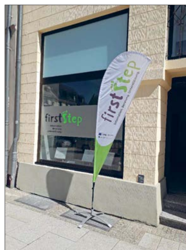
Die Anlauf- und Beratungsstelle am Markt 9 hat seit Juli wieder im Regelbetrieb geöffnet.

Trotzkopfworkshop Verlieren wir unsere Kinder? Was machen die Einschränkungen mit uns? Kleinkindschlaf Kleinkindschlaf Verlieren wir unsere Kinder? Was machen die Einschränkungen mit uns?