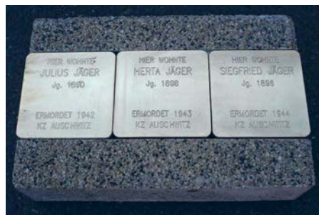
Gedenksteine für Familie Jäger