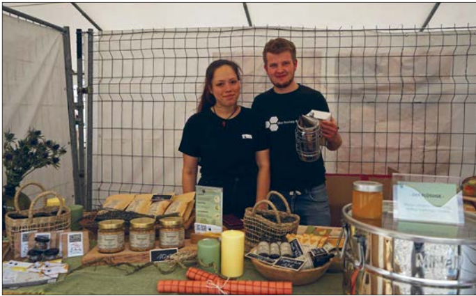
Rund um den Honig hieß es bei the honey factory

Auch gab es Seifen, selbst gebrautes Starkbier und Holzbearbeitung, die vorgeführt wurde. Die Marktbesucher konnten zudem frisch zubereitetes Essen und Trinken genießen.