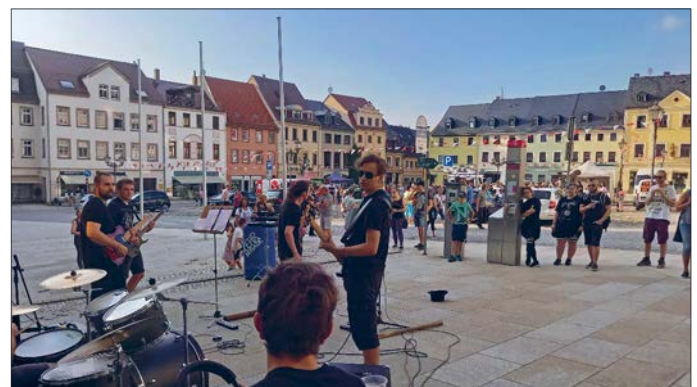
Die Band Projekt insanity spielte vor Barth Optik und ließ die Trommeln weit hallen. □