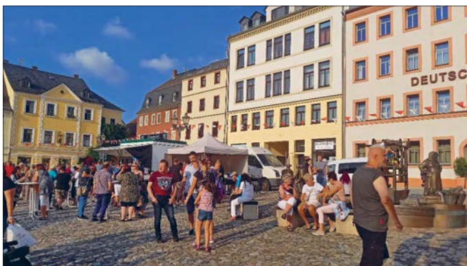
Die Glauchauer genossen es, sich wieder in der Stadt mit Freunden zu treffen.