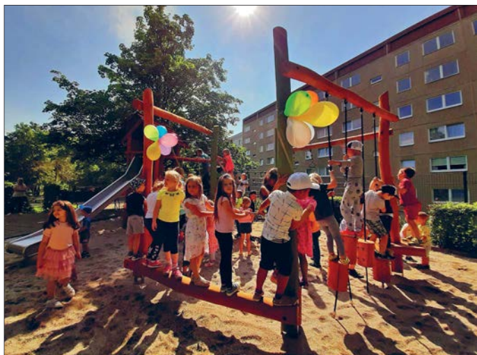
Die „Minis und Maxis“ erobern das neue Spielgerät.

Die Kinder der Kindertagesstätte „Minis und Maxis“ waren schon seit Tagen aufgeregt, denn ein neues Spielgerät mit Rutsche und verschiedenen Kletterelementen wurde im Kindergarten errichtet. Am Freitag, den 16. Juli 2021 erfolgte die Freigabe. Vertreter der Stadt Glauchau, Vertreter des Fördervereins Minis und Maxis e.V. und natürlich die Einrichtungsleitung gaben das Spielgerät an die Kinder frei. Ein Sturm der Begeisterung machte sich breit.