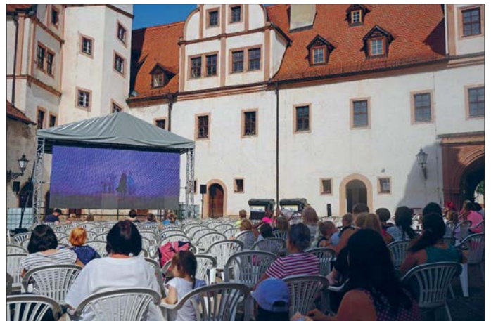
Etwa 60 Gäste kamen zum Sommerkino im Schlosshof

Der Sonntagnachmittag gehörte den jüngeren Glauchauern. Bei einem eintrittsfreien Familien Open Air Kino im Schlosshof Forderglauchau verfolgten kleine Fans von Elsa, Anna, Kristoff und Olaf die neuen Abenteuer ihrer Helden im Disneyfilm „Die Eiskönigin 2“. Zumeist kamen sie in Begleitung der Eltern oder Großeltern. Wer mochte, konnte sich das Filmerlebnis mit Eis, Popcorn und Getränken bereichern.