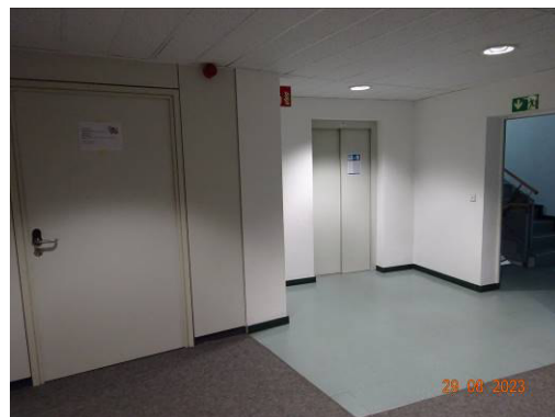
Zugang Treppenhaus / Fahrstuhl