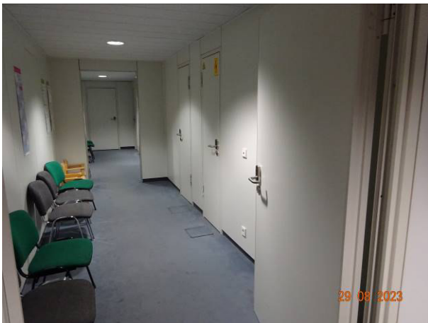
Eingangsbereich / Wartezone